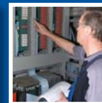
Сервис и услуги